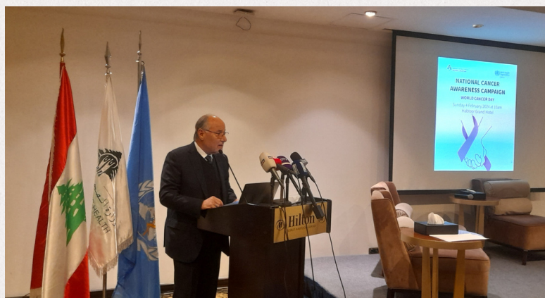
à gauche : SE. Firas Abiad, Ministre libanais de la Santé à droite : SE. Abbas El Halabi, Ministre de l'Éducation et de l'enseignement supérieur